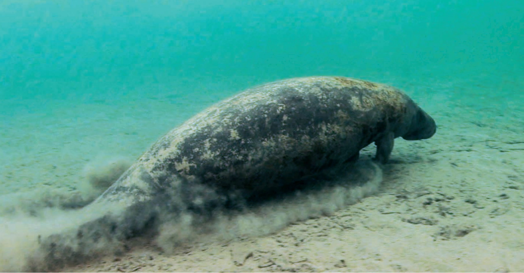
Manatí ( Trichechus manatus ). Área de Protección de Flora y Fauna Laguna de Términos, Campeche.