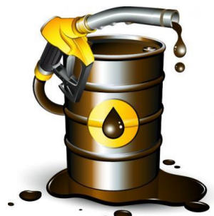
DERRAMÉ DE ACEITE