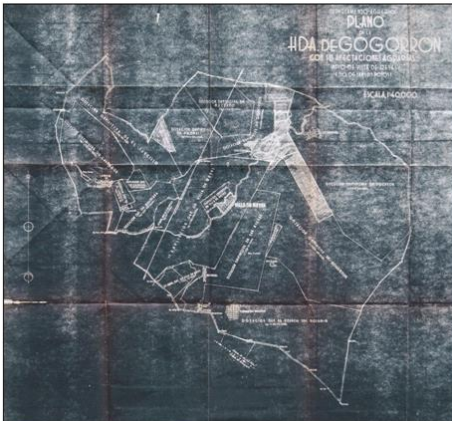
Figura 2. Plano General de la Hacienda de Gogorrón con sus afectaciones agrarias, elaborado por el Departamento Agrario, Municipio de Villa de Reyes, Estado de San Luis Potosí, sin fecha de elaboración, escala 1:40,000.